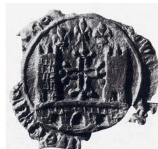
Armoiries de la ville sur sceau de 1389