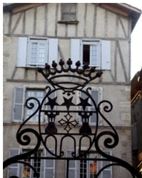
Armoiries de la ville Place de la Fontaine

Les éléments constituant le blason, dont l'origine remonte au Moyen-Age, révèlent une succession d'événements majeurs témoignant de l'essor de la ville durant cette période.