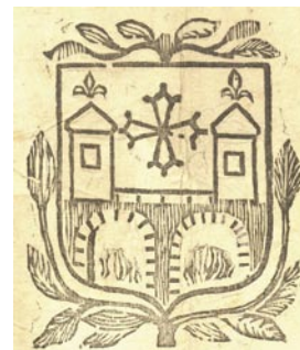
Blason du XVIIe imprimé chez Védeillié, imprimeur à Villefranche