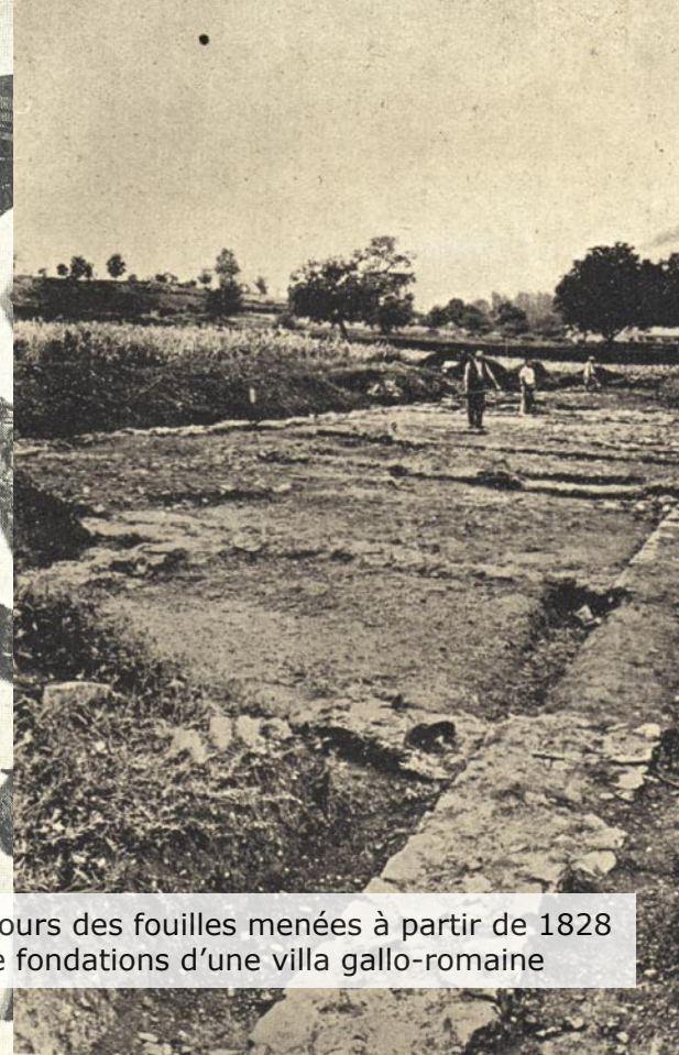
A gauche, objets découverts au cours des fouilles menées à partir de 1828 A droite, mise au jour en 1932 de fondations d'une villa gallo-romaine